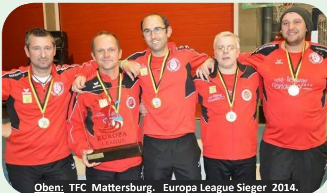
Oben: TFC Mattersburg. Europa League Sieger 2014.

Mannschaft: Österreichs U15 Team (Silber) FISTF Vize-Weltmeister 2016 in Mons (Belgien)